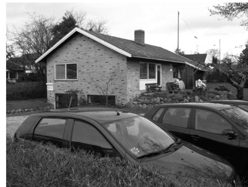
Lærernes hus set fra "bagsiden".

Vi har skiftet husnummer her ved årsskiftet. Adressen er nu Kongevejen 391 (tidligere nummer 91). Ændringen sker for at sikre at alle husnumrene er forskellige langs Kongevejen fra Lyngby til Hillerød.